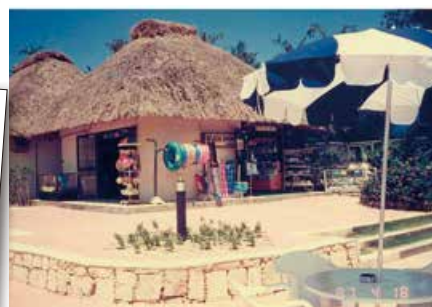
1987年 ビーチショップ (現アロマセラピーサロン)